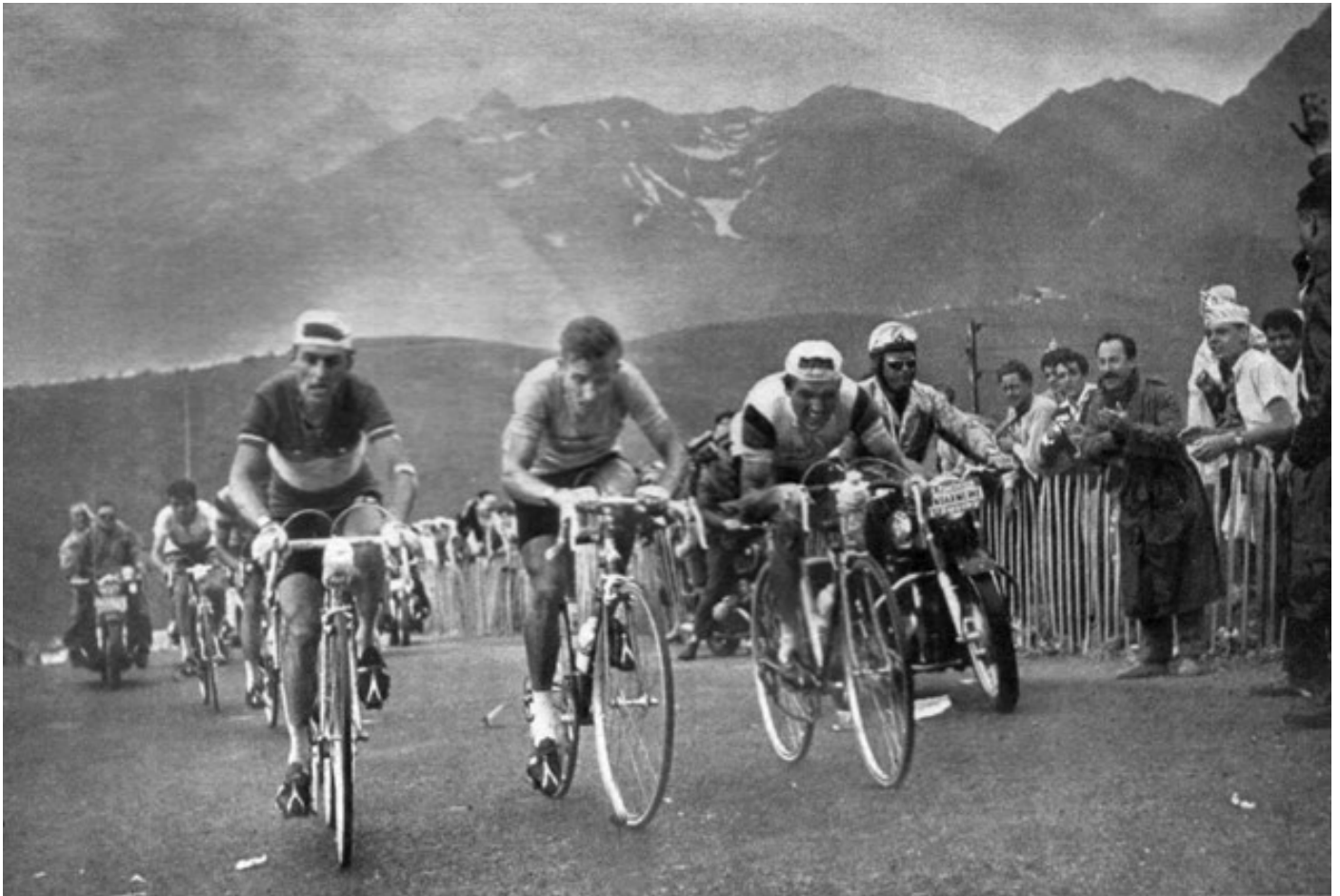
1961 Tour de France, 16e etappe: vanaf links, Charly Gaul, Jacques Anquetil en Hans Junkermann in de klim naar Superbagnères...

Mijn sportcarrière: 1948 (Krabbé is 5 jaar oud).