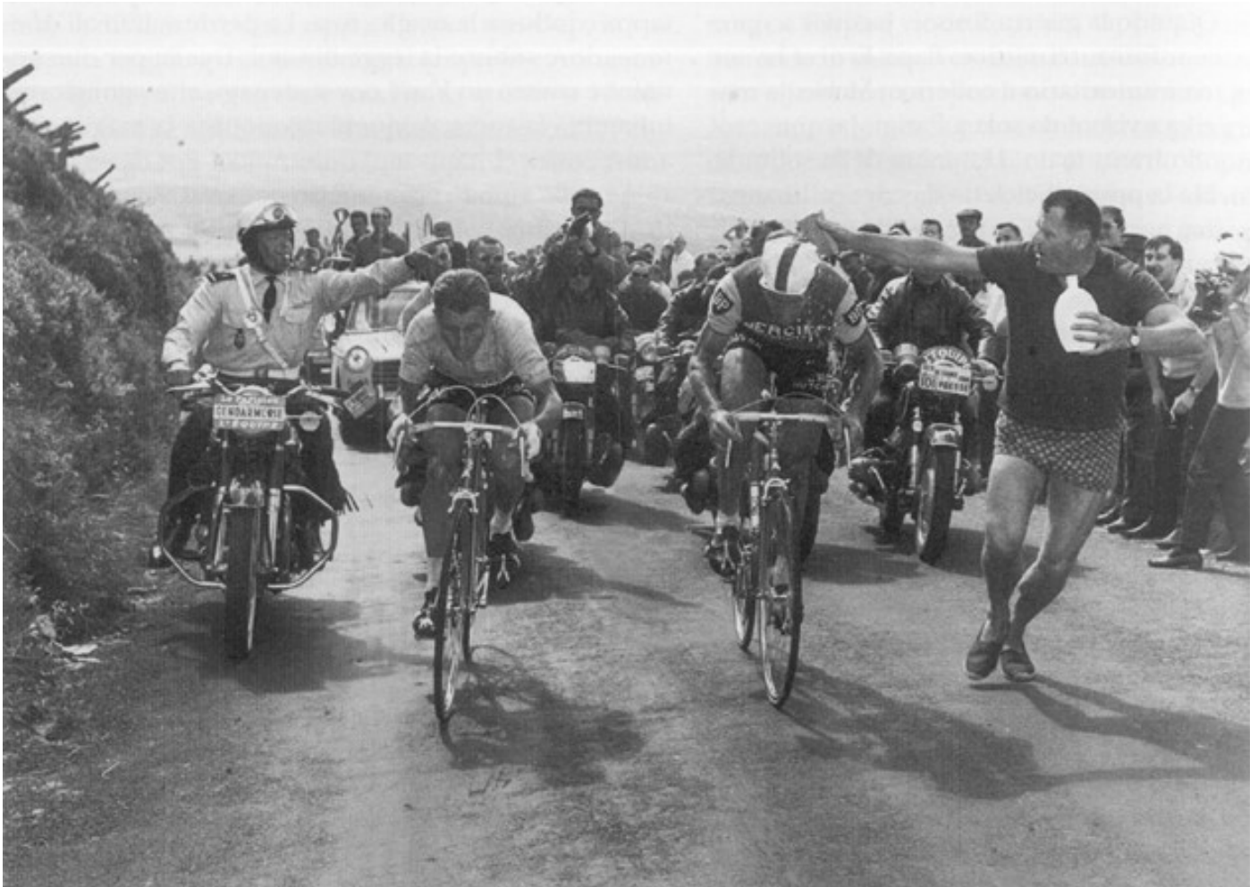
1964 Tour de France, 20e etappe: Anquetil en Poulidor rijden de Puy de Dôme op. Anquetil houdt met moeite de leiding...