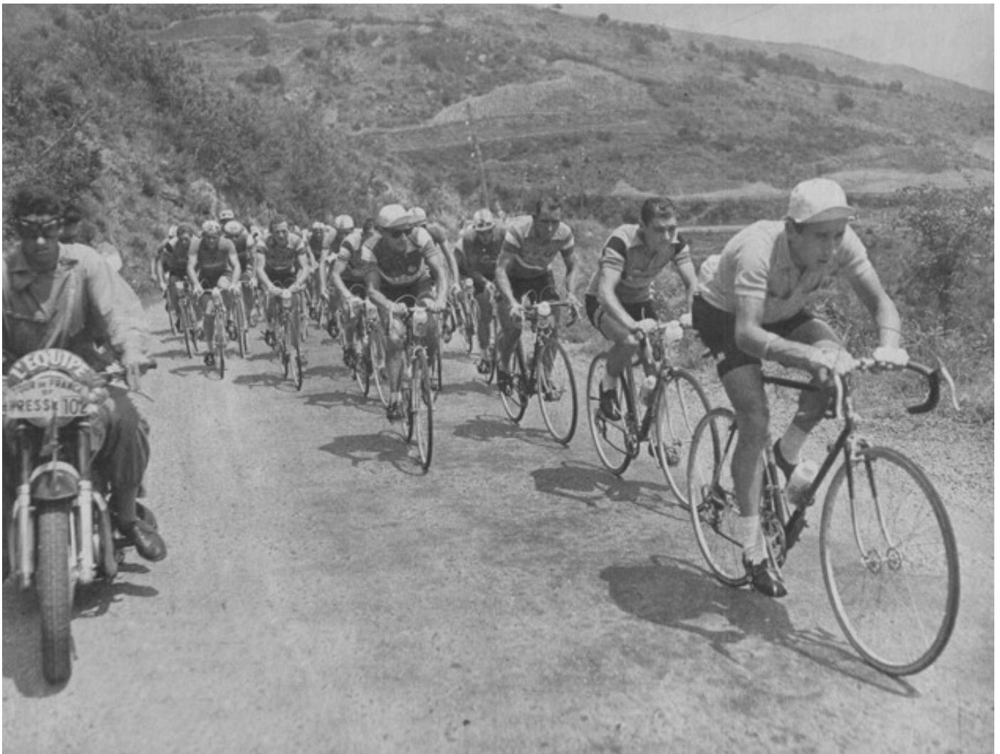
1957 Tour de France, 16e etappe: Anquetil gaat voorop in de beklimming van de Col de Tosas.

lichaam de prijs was die de dood kwam beuren voor een lang en lenig leven. Eenmaal boven zagen ze bleek en dronken ze sterkende limonades in vieze kleuren, maar de inspanning had hun ongetwijfeld de moed gegeven om weer een week plaats te nemen aan een bureau waar de kamerplanten herinneringen oproepen aan de natuurdocumentaires waarmee ze 's avonds hun atavismen troosten.”